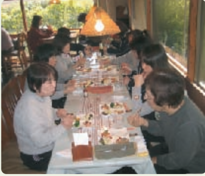
ささやかなお祝いの席

ヘルパーステーションわたぼうしは、今年で開設十周年を迎えました。これも利用者様やご家族の皆様、地域の方々のお陰と感謝しております。平成十四年二月一日にスタッフ三名という少数でスタートいたしました。現在ではスタッフは9名に増え、利用者様にお会いすることを楽しみに、訪問させていただいています。 利用者様の温かいお言葉・笑顔に元気をもらい、私たちスタッフに出来る心を込めた支援をお届けしていきたく思っております。今後とも頑張つて行きますので、末永くよろしくお願いいたします。 (難波)